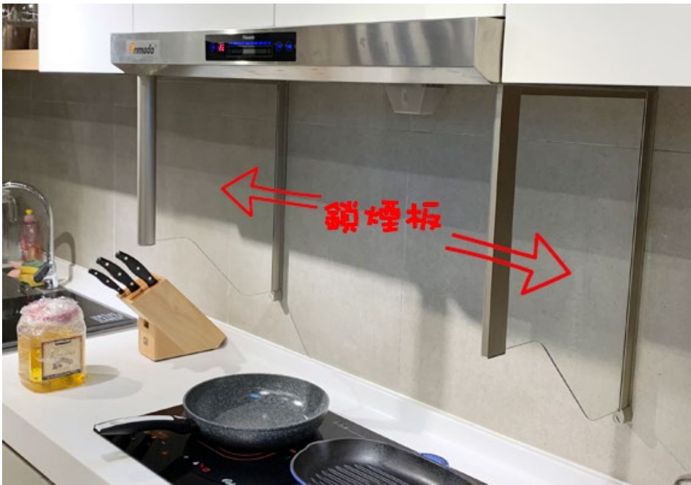
鎖煙板封實油煙，做到油煙不外洩。